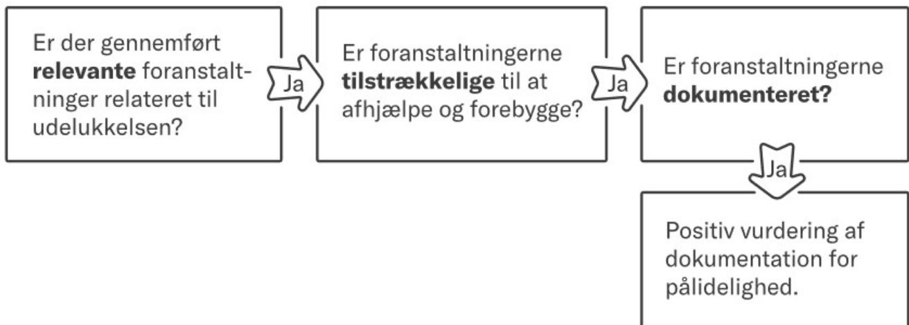
Figur 4.1 Trinvis vurdering af virksomhedernes foranstaltninger