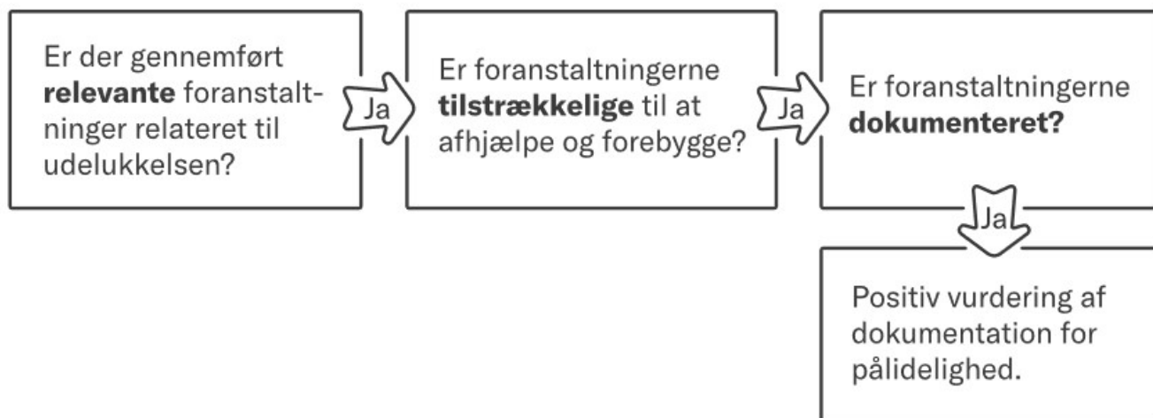
Figur 4.1 Trinvis vurdering af virksomhedernes foranstaltninger