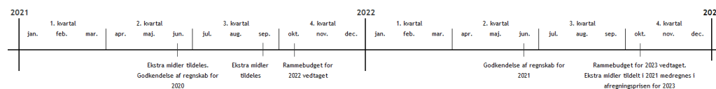
Figur 4.4 Tidslinje af Frederikssund Kommunes praksis for efterregulering af afregningsprisen