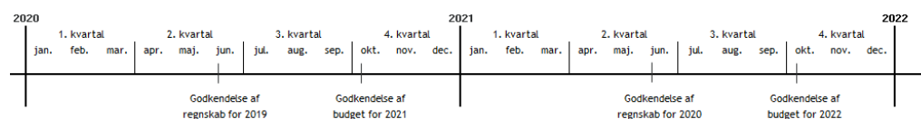
Figur 4.3 Oversigt over den tidsmæssige fastlæggelse af rammebudget og godkendelse af regnskabet

Kilde: Konkurrence- og Forbrugerstyrelsens sammenfatning på baggrund af klage fra Attendo og oplysninger fra Frederikssund Kommune